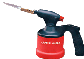
LAMPE A SOUDER